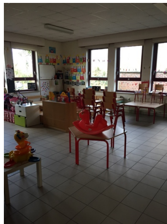
Klasje in de kleuterschool