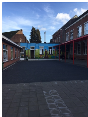
Speelplaats lagere school