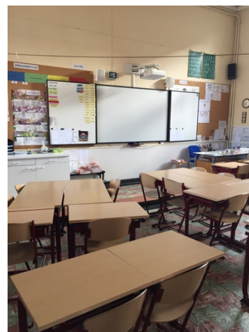
Klas 5de leerjaar