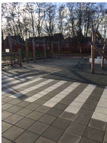
Speeltuigen lagere school